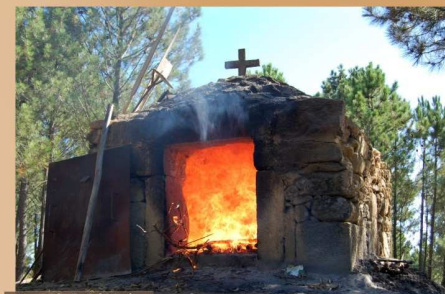
Forno da Sr.ª da Guia

A Nossa Senhora da Guia está sempre presente na reconstituição da romaria "Milagre d'Urgueira". Seja no alto das 3 colunas de granito, na entrada do parque, a saudar todos os que chegam, seja no repouso da sua ermida, ou na viagem anual que realiza e dá uma volta ao forno, pousada nos ombros das mulheres da Urgueira. Estas, tal como a Sr.ª da Guia, ainda resistem ao abandono e à desertificação da serra, ficando para que a Urgueira viva e a tradição reviva com ela.