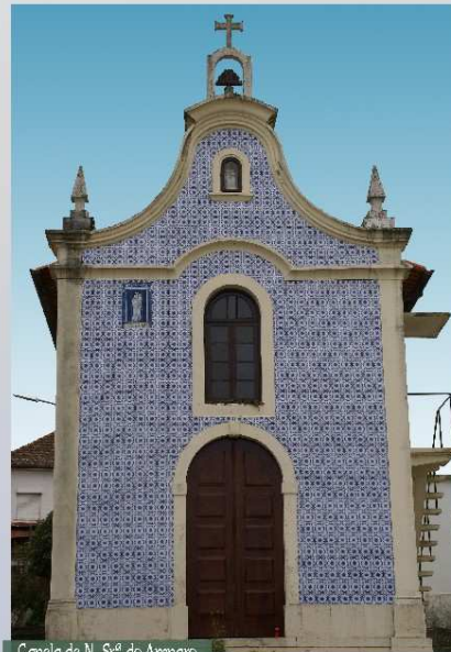
Capela de N. S.ª do Amparo