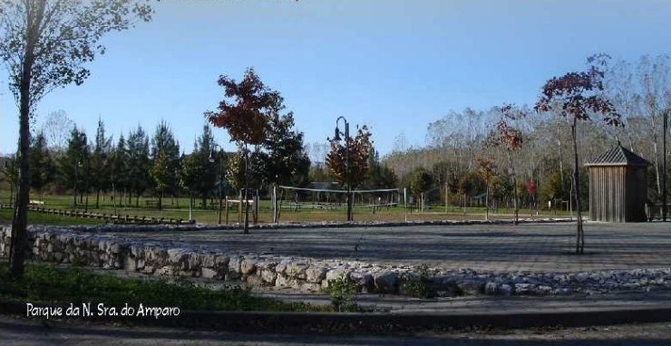
Parque da N. Sra. do Amparo

Para além das componentes histórica e cultural, riquíssimas em Travassô, a dimensão ambiental e paisagística assumem uma relevância maior sobretudo nas várzeas dos dois rios. Aqui, e no mosaico de campos agrícolas que compõem a paisagem dos "Bocage", ocorrem importantes ecossistemas inseridos na ZPE da Ria de Aveiro, e na zona húmida, que suportam importantes espécies de flora e fauna - ao longo do trilho podem observar-se espécies de aves como a Garça-vermelha, a Águia-de-casca-redonda, o Milhafre, a Cegonha-branca, a Galinha-de-água, etc. Ocorrem ainda mamíferos como a Lontra e a Raposa, e répteis, anfíbios e peixes, como a Engula, a Lampreia e o Sávie (entre tantas outras).