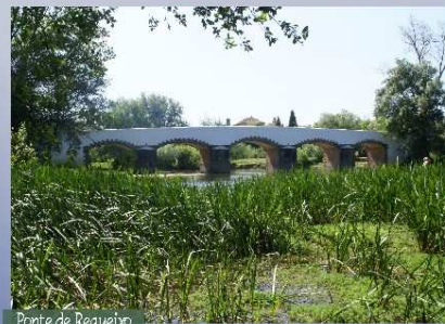
Ponte de Requeixo