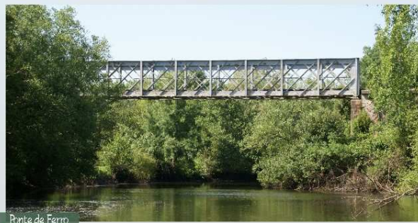
Ponte de Ferro

Atravessada a linha do Vouga, por caminhos bem definidos, e pelas ruas da povoação, rapidamente se chega à Igreja Matriz de Travassô, onde este percurso teve início.