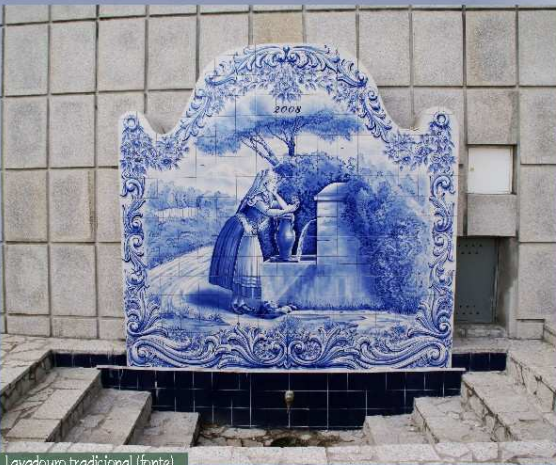
Lavadouro tradicional (fonte)